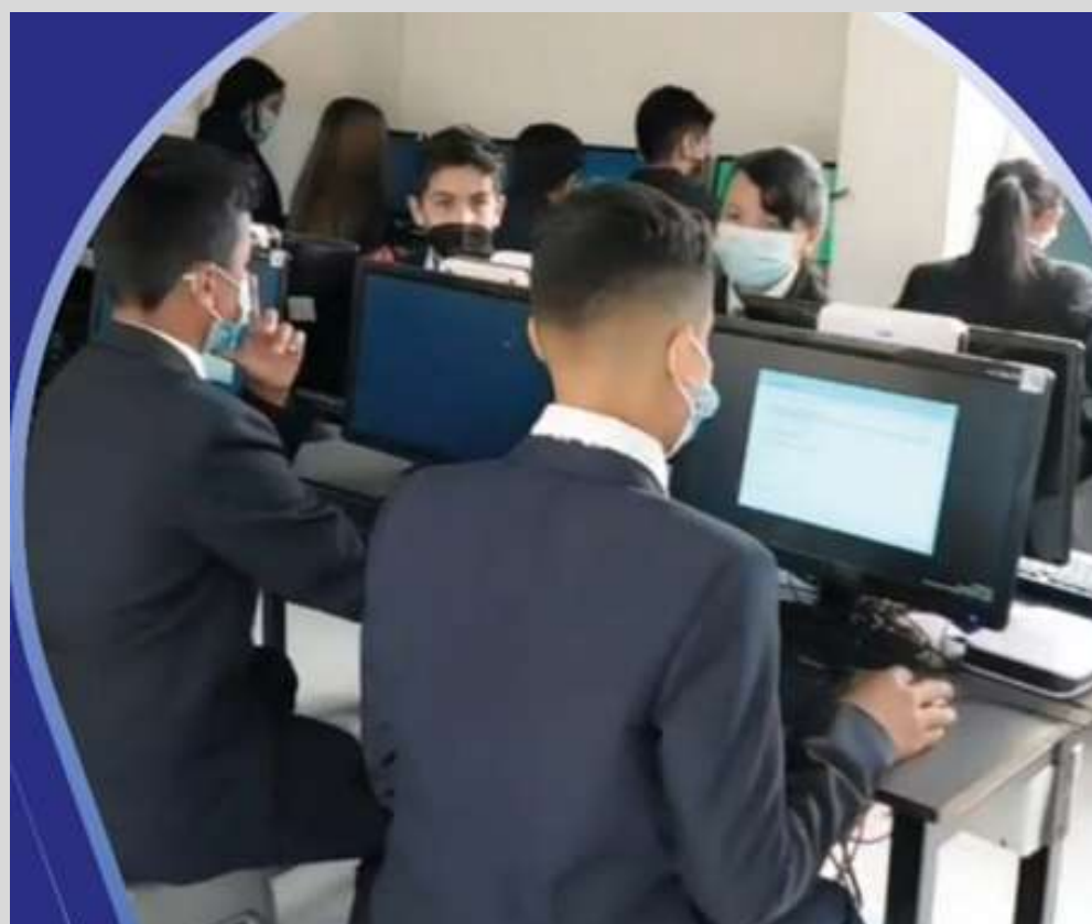
SALA DE SISTEMAS