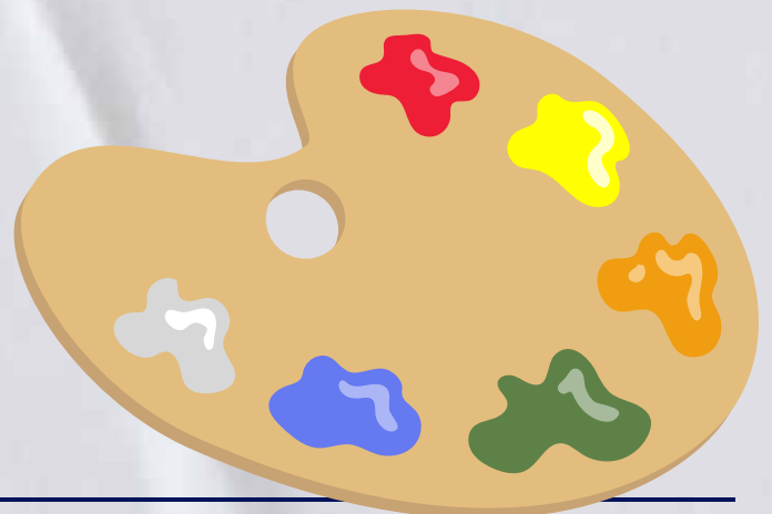
Franz Kafka Novela "La metamorfosis" Portada elaborada por Laura Campos 9ªA